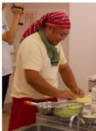
ポボさんのインタビューも楽しかったです。