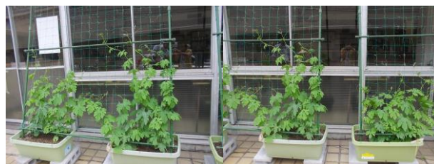
7月1日、適芯・ツルを横に誘引中 追肥もしましたよ～! 左2鉢の方が成長が良いみたい。