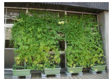
8月27日、グリーンカーテン完了! 写真撮影をさぼっていました…。 ゴーヤは50本位収穫できました。