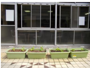
6月6日、苗植式後市役所へ 右2鉢は、たい肥多めで植えて みました。成長に差がでるかな?