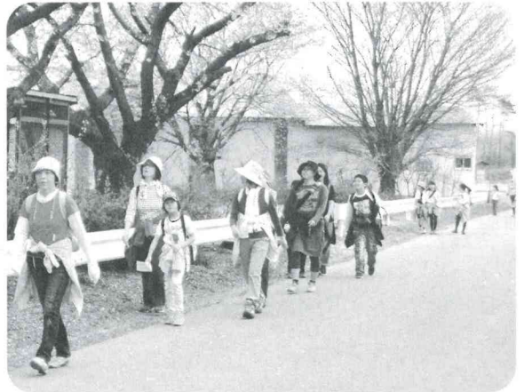
楽しく歩いてみませんか

黄色く鮮やかなれんぎょうや、美しい桜が咲くこの季節、家族や友人を誘って、ゆっくりと春を眺めてみませんか。下記の2つのコースから選べます。