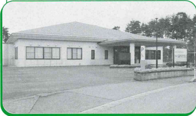
▲健康プラザしうんじ