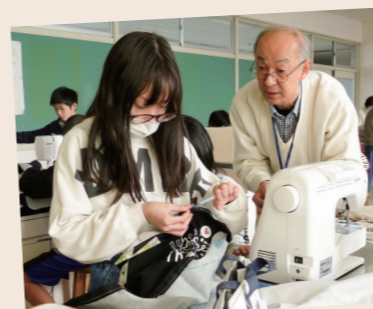
▲アドバイスを受けながら、裁縫に挑戦。子どもも大人も真剣です