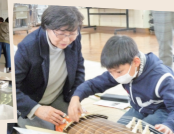
▲初めての琴演奏!? 表情から一生懸命さが伝わります

場し、ソウルでは銅メダル、バルセロナでは5位入賞を果たすことができました。 現役引退後は、日本代表や実業団の監督を経て、平成21年に今の大学の監督に就任しました。 「敬和学園大学で指導しようと思ったきっかけは?」 務めていた実業団での活動がちょうど節目の頃に、複数の誘いをいただき、敬和学園大学もその一つでした。