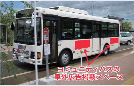
▲新発田市コミュニティバス

☎ 広告掲載料のほか、広告作成・撤去(車外のみ)費も必要です。川東コミュニティバスへの広告掲載については、①へお問い合わせください