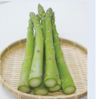
▲「ふとっパラプレミアム」

【ふとっパラプレミアム】 春先に少量しか採れない、幻の極太アスパラガスです。 販売店舗=JA北越後農産物直売所(島潟)