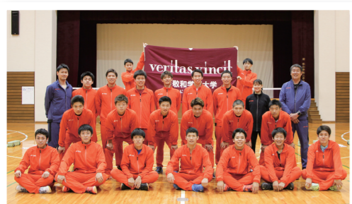
部員全員で撮影した一枚。初めて女子部員が加入し、和やかな雰囲気の中にも、チームの団結力を感じます

現在の部員数は22人ですが、最初は4人でのスタートでした。新発田にある小さな大学に、バドミントンをするために来る学生はわずか、苦しい時代が続きました。それでも選手の勧誘に行き、私の熱意を伝え続けました。その甲斐もあつてか、今では選手側がこの大学を選んでくれるようになりました。正にゼロからのチームづくりで、とても苦労しました。