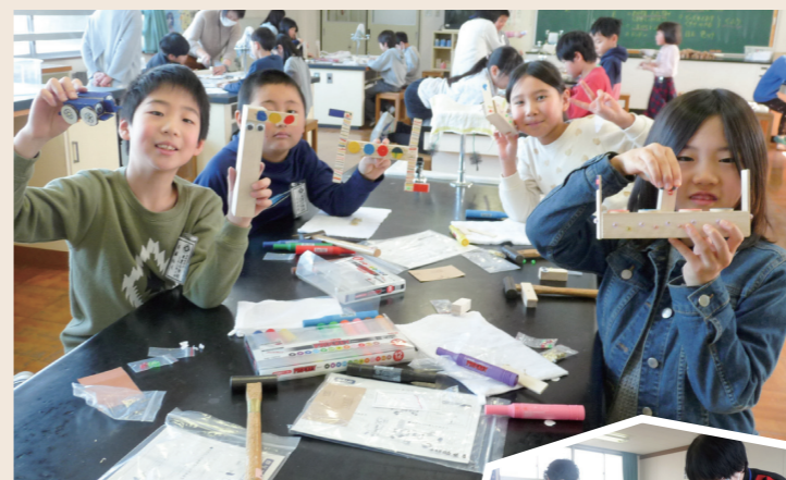
▲優しい地域の先生に教わり、作品が完成。パッチリの出来栄です ▶使い慣れない「金づち」を片手に、正にくぎ付けの表情

子どもたちは、木工や裁縫、琴の演奏などの活動を通じて、「地域の先生」から多くのことを教わり、人とのつながりや感謝の心を持つことの大切さを学んでいます。