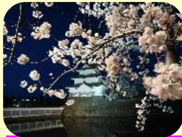
しばた じょうし こうえん さくら 新発田 城址 公園 桜まつり