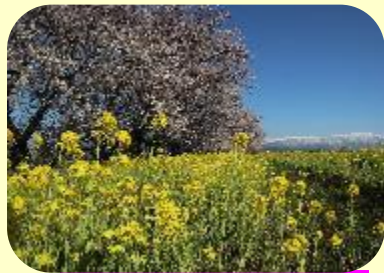
かじかわ ちすい きねん こうえん 加治川 治水 記念 公園