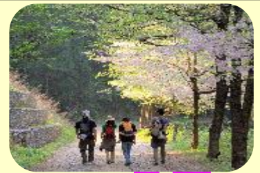
おおみねやま さくら こうえん 大峰山 桜 公園