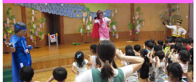
食育教室：優の森こども園での様子

多くの人が集まる場に出向いたり、ラジオ放送に出演するなど、色々な形で市民の皆さんへ健康づくりを呼びかけています。