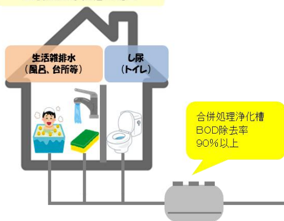
合併処理浄化槽の場合

合併処理浄化槽は、単独処理浄化槽と比べると排出される汚れの量が約1/8になります。