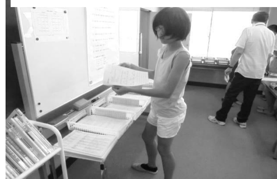
補助プリントも利用しやすくなりました