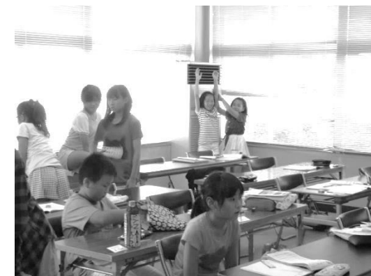
休憩時間はしっかりくつろいで・・・

まずは申し込みを！いつでも申し込み・・・OK！ 自分の都合に合わせて参加・・・OK！ 用事があって、途中から参加、途中で帰る・・・OK！ ためしに参加・・・OK