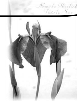
<文責：コーディネーター 細野>

まずは申し込みを！いつでも申し込み・・・OK！ 自分の都合に合わせて参加・・・OK！ 用事があって、途中から参加、途中で帰る・・・OK！ ためしに参加・・・OK