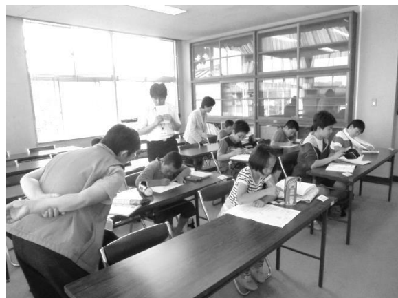
昨年から引き続きの講師先生も・・・皆さん温かく接してくださっています