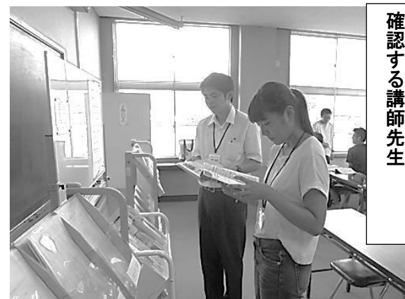
休憩時間に学習内容を確認する講師先生

一步踏み出そう！「めんどくさい」に負けないで そこで「新しい自分の素晴らしさ」に気づく ことができる