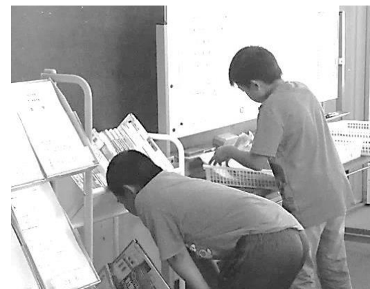
学習プリントの内容を確認し選ぶ塾生