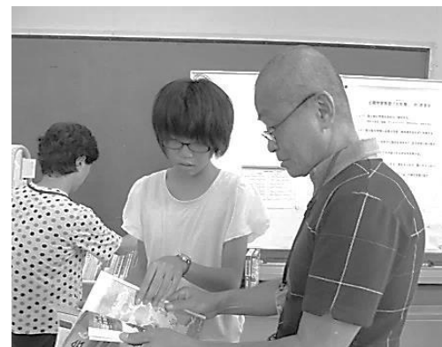
塾生・講師先生のリクエストの学習プリントを用意