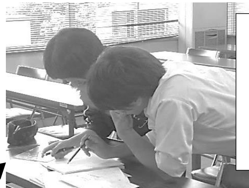
終了時刻が過ぎても講師先生と課題解決