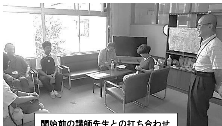
開始前の講師先生との打ち合わせ