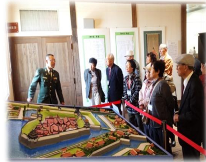
[白壁兵舎広報資料館]