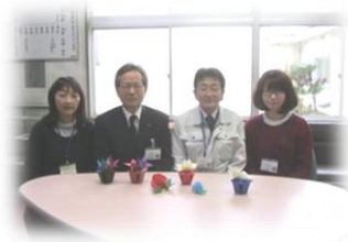
加治川地区公民館職員一同