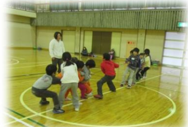
綱引きやドッチボールもしたよ。