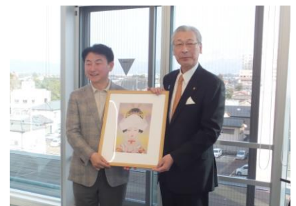
(左：金东根市长，右：二阶堂市长)

新发田市和议政府市从1980年开始一直通过体育活动进行着儿童间的交流。这次的访问也是为了8月份的体育交流活动。二阶堂市长表示：将会全力支持搞好这次两国儿童的交流活动。