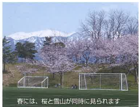
春には、桜と雪山が同時に見られます

Vリーグ 男女バレー bjリーグ バスケット 新潟県高校総体各種競技 新潟県中学校総体各種競技 2017大相撲夏巡業新発田場所