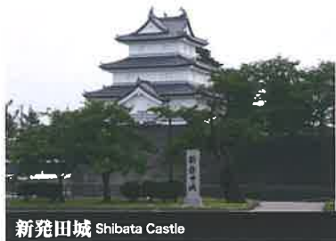
新発田城 Shibata Castle