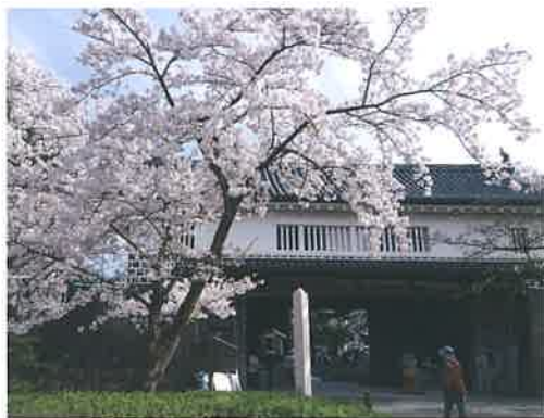
新発田市の木：サクラ