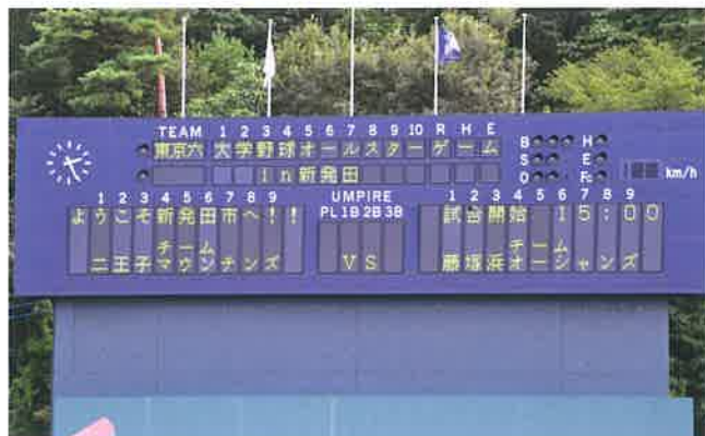
スピードガンを設置したスコアボード