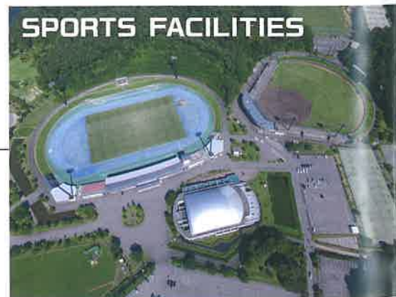
緑豊かな森林に囲まれたスポーツ施設の数々。スポーツ合宿にも適した「芝生と土」が自慢です。