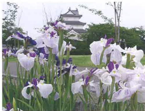
新発田市の花：アヤメ