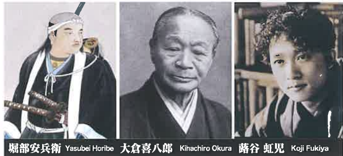
堀部安兵衛 Yasubei Horibe 大倉喜八郎 Kihachiro Okura 落谷虹児 Koji Fukuya

■ 堀部安兵衛 Yasubei Horibe 堀部安兵衛武庸は、新発田が生んだ剣豪。赤穂義士四十七士の中 でも名高い剣客。安兵衛の生家の菩提寺長徳寺の境内には安兵衛 が江戸へ発つ時に植えた松の木(現在は二世)がある。 問い合わせ先／(一社)新発田市観光協会 (0254-26-6789)