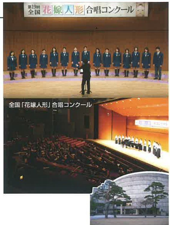
全国「花嫁人形」合唱コンクール