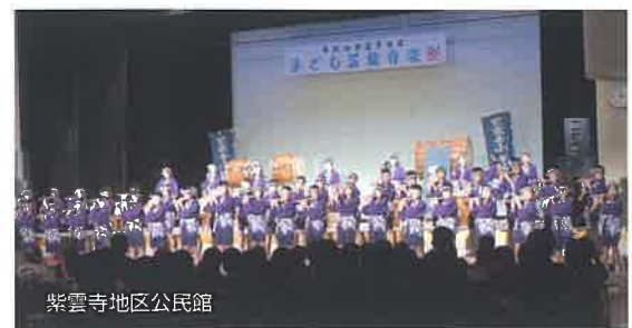
紫雲寺地区公民館