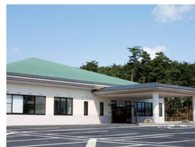
▲移転先の「健康プラザしゅうんじ」

「紫雲寺庁舎」は、昭和48年の竣工から40年以上が経過し、建物の老朽化が進んでいることに加え、耐震化が不十分であるため、紫雲寺支所を「健康プラザしゅうんじ」内に移転します。施設内には、新発田北地域包括支援センターや健康増進スタジオ、調理室などがあります。支所の移転により、行政手続きと併せて高齢者の相談や健康管理が 「紫雲寺庁舎」は、昭和48年の竣工から40年以上が経過し、建物の老朽化が進んでいることに加え、耐震化が不十分であるため、紫雲寺支所を「健康プラザしゅうんじ」内に移転します。 施設内には、新発田北地域包括支援センターや健康増進スタジオ、調理室などがあります。支所の移転により、行政手続きと併せて高齢者の相談や健康管理が 行えるなど、複合的な機能を併せ持つ支所として生まれ変わります。なお、移転先での業務開始は、3月28日(日)です。 【移転後の住所】〒957-0232、真野原外3331-5 ※電話番号とファックス番号は、変更ありません。