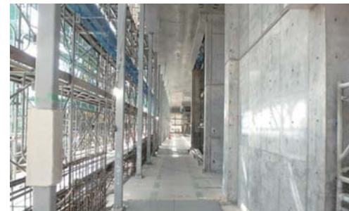
▲工事現場内部の様子