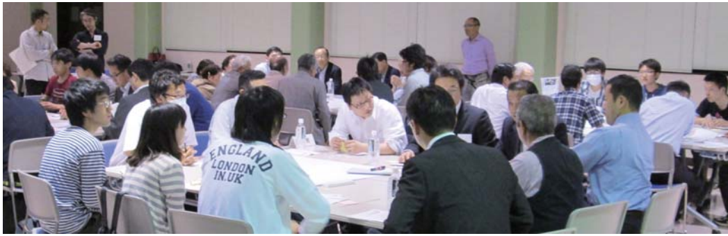
▲市民ラウンドテーブルの様子