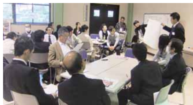
▲協働アクションセミナーの様子

ある専用ポストへ投函してください ■提出先・問合せ先 新庁舎建設室 (〒957-8686 住所記載不要、☎22-3101、FAX 26-3110、Eメール chosha@city.shibata.lg.jp)