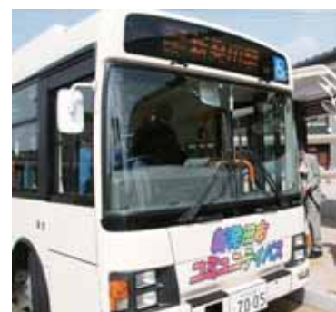
▲コミュニティバス運行の様子

いきいき館、まちの駅、市民文化会館、各地区公民館、生涯学習センターに資料を設置します 市民参画の手法 意見公募(パブリックコメント)、意見交換会、アンケート、ワークショップ、審議会など。意見の公募やアンケート、地域課題を地域とともに検討するなど、1つの事業に対して複数の手法を用いています 募集期間 1月25日(金)～2月25日(月) 提出方法 郵送、ファック