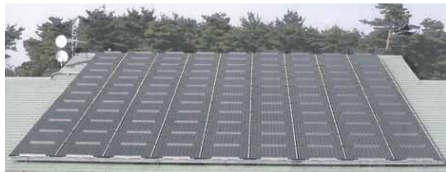
▲新エネルギーの1つ「太陽光発電」

主な計画内容 策定の背景と目的、新発田市の新エネルギー導入方針、市民・事業者・行政のそれぞれの役割など 閲覧場所 市本庁舎及び各支所1階、まちの駅、生涯学習センターで閲覧できるほか、市ホームページでご覧いただけます 募集期間 2月1日(金)～3月4日(月) 提出方法 郵送、ファック