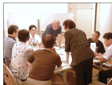
1班 グループワーク