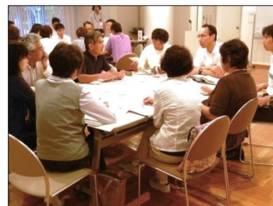
2班 グループワーク