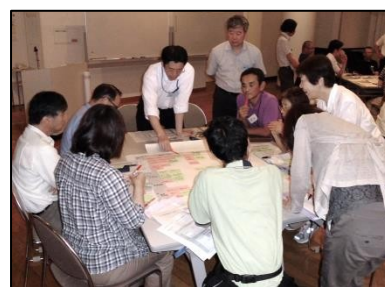
3班 グループワーク