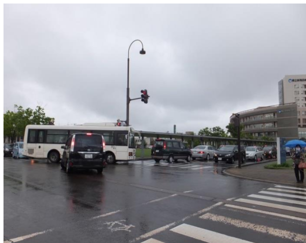
県立病院前で渋滞に巻き込まれるコミュニティバス