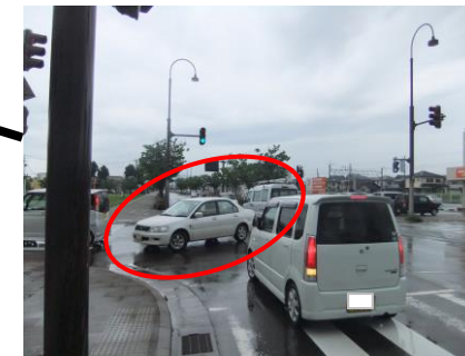
強引に右折する車両