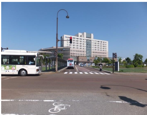
順調に走行するあやめバス「いっすんぼうし号」と「新発田市コミュニティバス（菅谷・加治）」

そういった中、数年前から県立新発田病院周辺の道路渋滞により、バスが10分から30分も遅れが生じていると、バス利用者をはじめ地域住民の皆様から苦情が寄せられるようになり、渋滞解消に向けた対策が求められています。