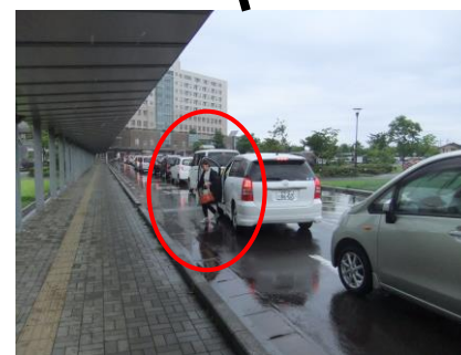
待ちきれず途中で降車する人