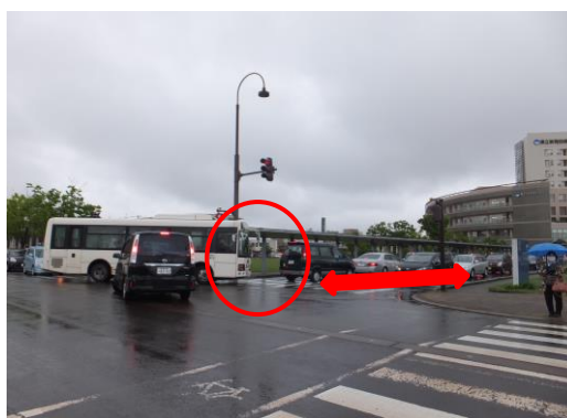
駐車場待ちの列が横断歩道まで続くと、バスが左折する際の支障に…