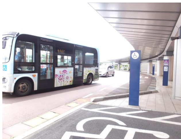
県立病院内のバス停と川東コミュニティバス