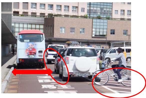
ゼブラゾーンを避けて停車するため、走行車線の道幅が狭くなり、走行の支障に…