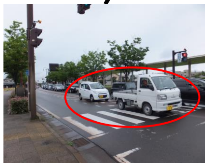
直進車がゼブラゾーンに侵入し通過