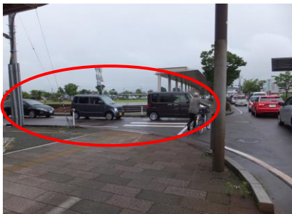
脇道から侵入しようとする車両