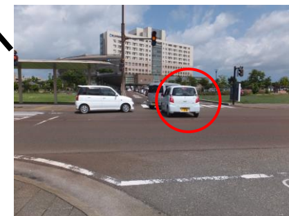
川東方面9台待ち。右折ができないことからいったん薬局側に左折し、方向を変えてから無理に直進で侵入する車両