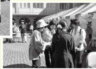
(10月25日の敬和祭での啓発活動)

●敬和学園大学の学園祭(敬和祭)の会場内において、啓発用パンフレットなどを配布し、選挙参加の呼び掛けを行いました。