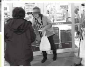
(市長選挙・衆議院議員総選挙での街頭啓発活動)

●選挙のたびごとに、市内の大型店舗において政治参加、棄権防止の呼びかけを行っています。