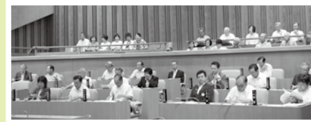
(9月11日の市議会傍聴)

今年度は、市議会9月定例会の本会議（一般質問）を傍聴、推進員等延15名が参加しました。