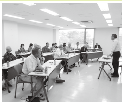
(9月30日の推進員等研修会)

選挙に関する理解を深めるため、選挙管理委員会事務局を講師に迎え、「三つの運動・政治家の寄附禁止」についての研修会を開催、推進員等22名が参加しました。