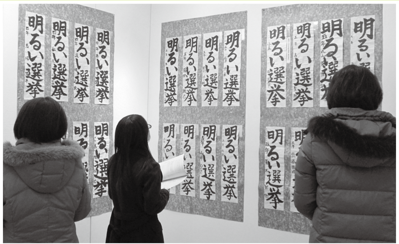
(第40回記念・平成27年新発田市明るい選挙推進「市民書初め大会」の作品展風景：新発田市生涯学習センター)

発行 新発田市明るい選挙推進協議会 新発田市選挙管理委員会 新発田市中央町4丁目8番11号 ☎(0254) 22-3101(代)