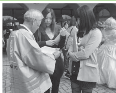
(10月19日の敬和祭での啓発活動)

●敬和学園大学の学園祭(敬和祭)の会場内において、啓発用パンフレットなどを配布し、選挙参加の呼びかけを行いました。