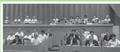
(9月11日の市議会傍聴)

今年度は、市議会9月定例会と県議会12月定例会の本会議(一般質問)を傍聴、推進員等延38名が参加しました。