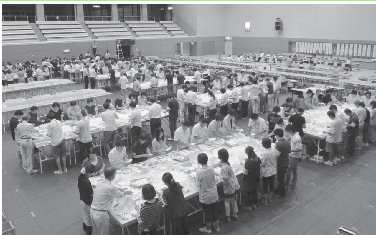
(平成25年7月21日執行の参議院議員通常選挙開票風景：新発田市カルチャーセンター)

発行 新発田市明るい選挙推進協議会 新発田市選挙管理委員会 新発田市中央町4丁目8番11号 ☎(0254)22-3101代