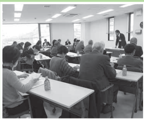
(12月18日の選挙制度等研修会)