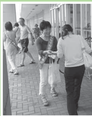
(参議院選挙街頭啓発活動)

●選挙のたびごとに、市内の大型店舗において政治参加、棄権防止の呼びかけを行っています。