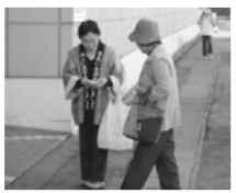
(新潟県知事選挙での啓発活動)

選挙のたびごとに、市内の大型店舗において政治参加、棄権防止の呼びかけを行っています。