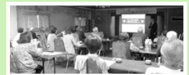
(4月27日の推進員等研修会)

選挙に関する理解を深めるため、選挙管理委員会事務局を講師に迎え、「18歳選挙権と投票環境の向上」をテーマに、上へ委員みなんで考える選挙啓発を目指して、この研修会を開催、推進員等23名が参加しました。