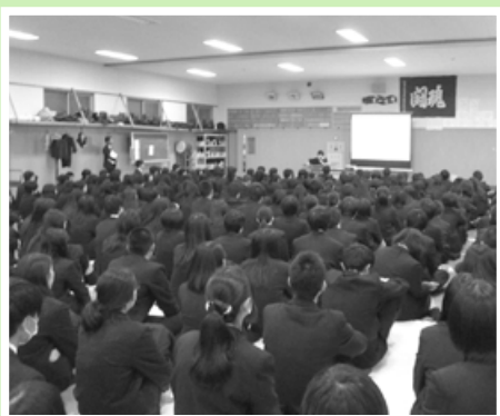
新発田商業高校での「明るい選挙出前授業」の様子

選挙を通じて、未来の日本の在り方を決める政治に積極的に参加することが期待されます。