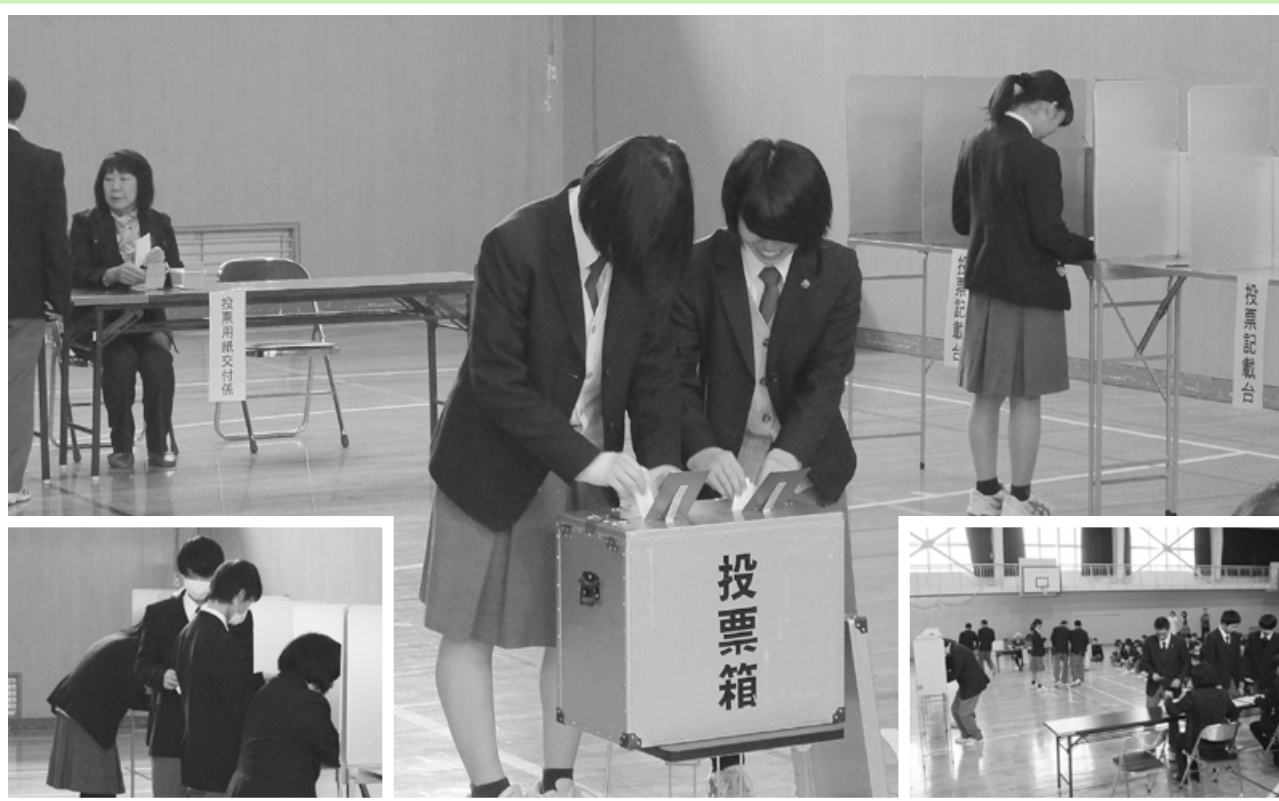
(明るい選挙出前授業 模擬投票風景：新発田南高校)

発行 新発田市明るい選挙推進協議会 新発田市選挙管理委員会 新発田市中央町4丁目8番11号 ☎(0254)22-3030(代)