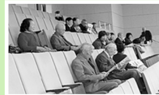
(12月13日の県議会傍聴)

市政や県政に対する関心を深め、また、議会議員の活動を知るため議会傍聴を毎年実施しています。