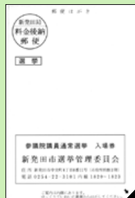
今までの投票所入場券

期日前投票の際は、ご自分の投票所入場券を切り離し、裏面の宣誓書に必要事項を記入して持参するとスムーズに受付できます。