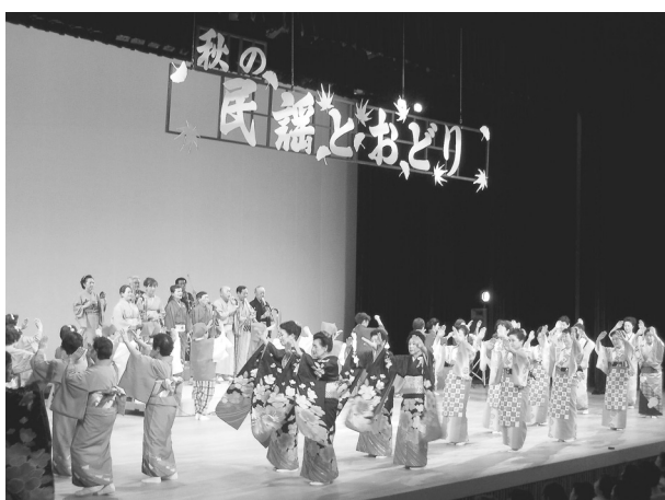
◇秋の民謡とおどり