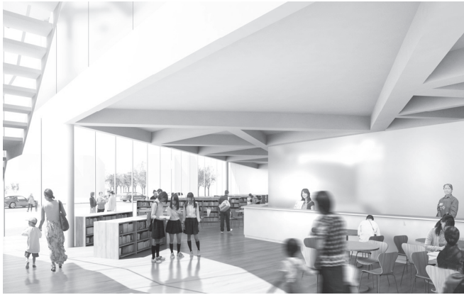
エントランスのイメージ