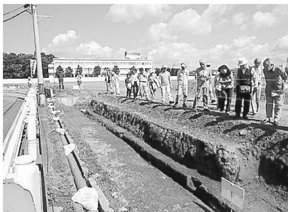
新発田城跡（県立病院跡地）現地説明会

小学校6年生への社会科出張授業、発掘調査現場の現地説明会、発掘調査出土品展を実施する。また、加治川展示室で市が所蔵する出土品、民具などを展示・公開する。