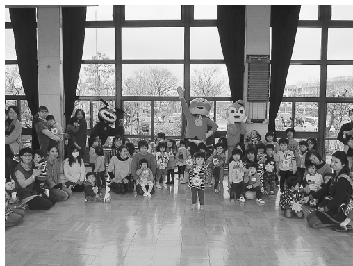
〈ちびっこワールド〉