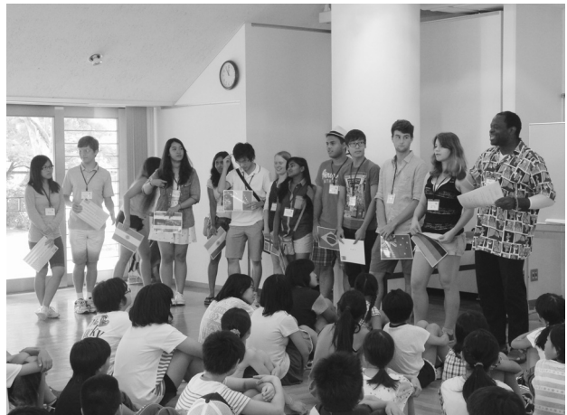
小学生国際理解教育事業「夏休みにALTとあそぼう♪」

夏休み期間を利用し、小学生を対象としたALTによる国際理解教室を開催し、遊び、ゲーム等を通じて英語や異文化の国際的な理解を推進する。