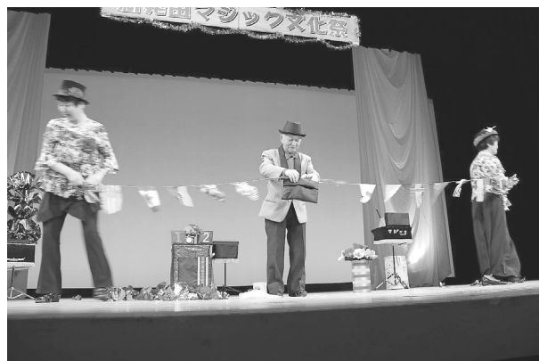
◇新発田マジック文化祭