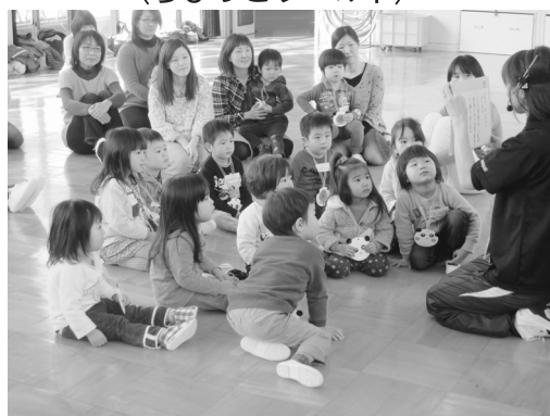
〈ちびっこワールド〉