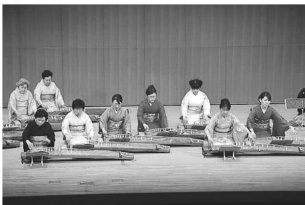
◇琴・三絃・尺八演奏会