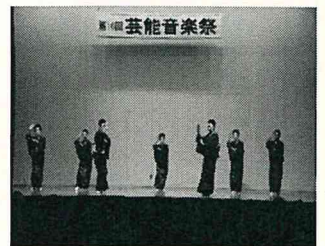
紫雲寺民謡研究会