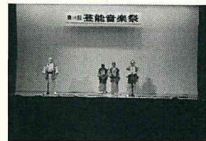
新発田相撲甚句会