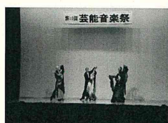
ダンスサークル・ベル