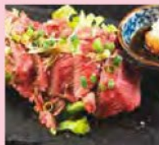
・新発田牛のタタキ 1,800円