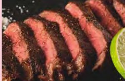
・新発田牛ステーキ 2,400円