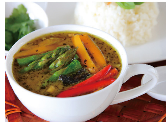
テイクアウトのみ 1日限定20食 アスパラグリーンカレー…800円

〒中央町3丁目8-10 ☎0254-22-3868 🕒17:30~23:00 🗓水曜 🇯なし