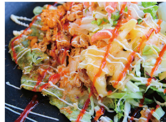
テイクアウトのみ 1日限定5食 ~アスパラタコミート~ オムタコ…800円

〒中央町3丁目2-23 ☎050-3468-2322 🕒12:00~15:00, 18:00~24:00 🗓火曜、土日はランチのみ休み 🇯なし