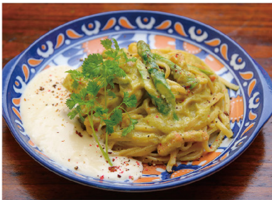
アスパラピューレの クリームパスタ…1,100円

〒本田3649-1 ☎0254-32-2572 🕒11:00~14:30 / 16:30~19:00 (テイクアウト・予約のみ) ※水曜以外 🗓なし 🇯6台