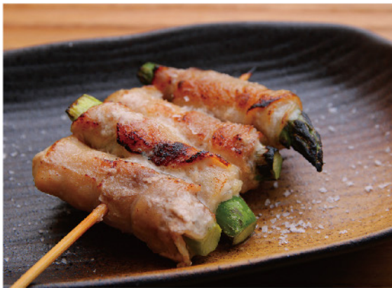
炭焼き肉巻き アスパラ…330円

〒豊町4丁目8-31 ☎070-2622-3549 🕒11:00~14:00(LO) 8:00~10:00(土日のみモーニング営業) 🗓月曜・火曜 🇯6台