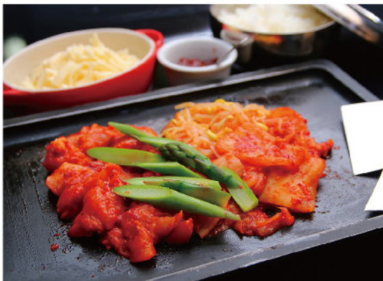
アスパラチーズタッカルビ チャーハン…1,320円

テーブルにある鉄板でタッカルビとごはんを炒め合わせ、 チーズを加えてお好みのお味のチャーハンをお作りください。