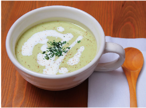
アスパラのポタージュ…450円