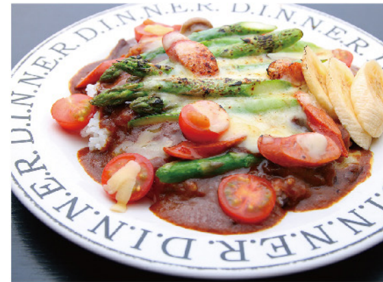
アスパラ焼きカレー…960円

〒中央町4丁目9-3 ☎0254-37-1203 🕒17:30~24:00 🗓不定休 🇯なし