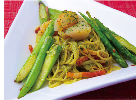
アスパラとほたての バジルアスパラソース…1,400円

※ランチのみコース料理だけの営業、その中にポタージュを含みます。 ※税込み2,500円コース、要予約、ランチは当日NG、 ディナーは予約なしでも可能。ディナーは単品提供。