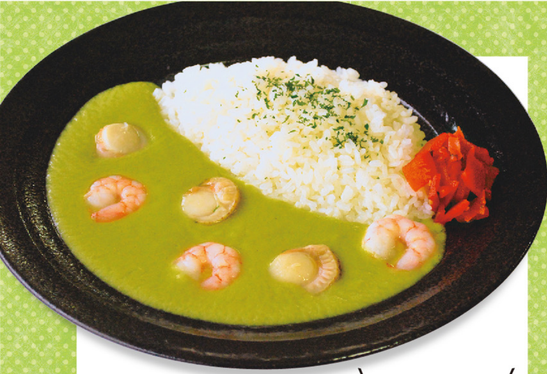
アスパラみどりカレー …980円