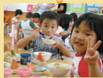
「全部食べられるよ!」 =おいしい給食・川東保育園=