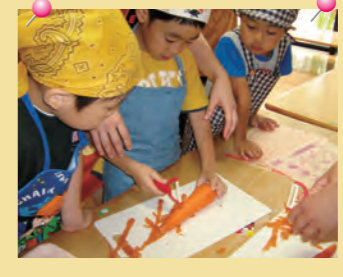
「野菜の皮むき上手だね」 =野菜のポタージュづくり・ 百華保育園=