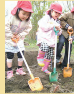
「野菜がおいしくなる 畑を作るよ!」 =畑づくり・佐々木保育園=

園で工夫した“みんなの畑”で野菜がよろこぶ土づくり、種まき後は「やさしく、ていねい」に野菜を育て、みんなの愛情がたっぷり詰まった新鮮野菜を収穫!