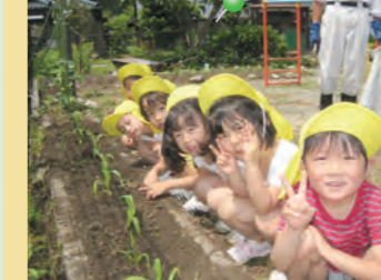
「おいしいトウモロコシ に育てね!」 =栽培活動・うずが森保育園=