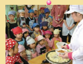
「大豆っていろんな料理に変身するよ」 =豆腐、おから作り・キッズ陽だまり園=