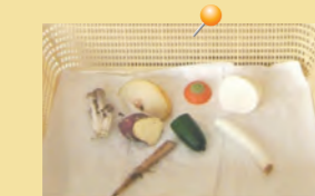
=献立とその食材、食べ物の 動きを展示・優の森保育園=