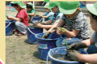
「冷たいドロって気持ちいい!」 =バケツで田植え・大栄保育園=