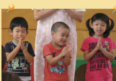
「いただきます!」「ごちそうさまでした!」 =心をこめて食事のあいさつ・五十公野保育園・中井保育園=

毎日楽しい給食の時間「いただきます〜す!」元気な子ども達の声。おいしい食事をよく噛んで、しっかり味わったら食器はピカピカ。はい完食です!