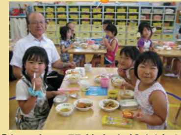
「おいしい野菜をありがとう」 =給食食材生産者との交流・川東保育園=