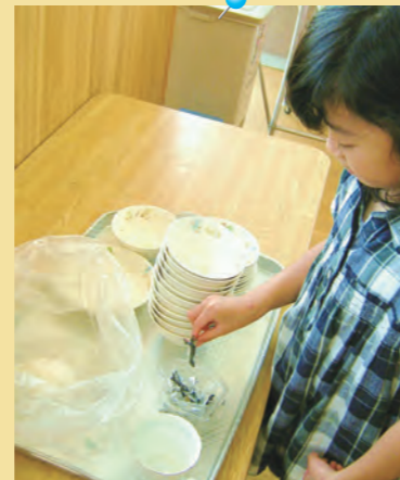
「食べたからお片付け 毎日やってるよ!」 =食後の片付け・優の森保育園=