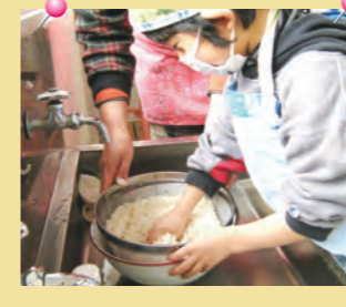
「お米をとぐの はじめて!」 =炊飯体験・ あやめ幼稚園=

「しばたっ子シェフ」達が自慢の腕を披露。みんなで育てた野菜や地元の農家さんが育ててくれた安心な旬の野菜を使って、楽しくお料理!