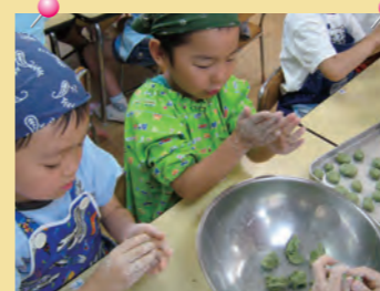
「お団子どんな形にしようかな・・・」 =よもぎ団子作り・藤塚浜保育園=