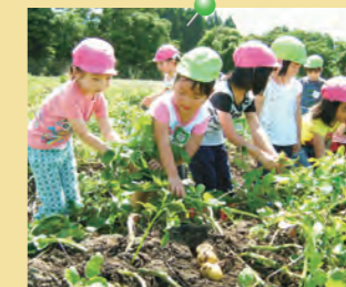
「う〜ん じゃがいもが 出てこない!」 =じゃがいも収穫体験・ 川東保育園=