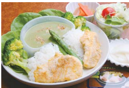
▲メニューの一例「アスパラダムカレー」