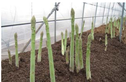
▲新発田産のアスパラガス

詳しくは、ヨリネスしばたなどの公共施設やイベントで配布するパンフレットをご覧くださいか、「新発田市食の循環によるまちづくり」ホームページに掲載している「食のアスパラ横丁、味めぐり」をご覧ください。