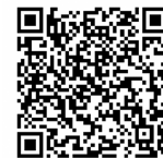
【新発田市公式 LINE QRコード】

※予約の受付期間：希望日の14日前～2日前の正午まで ※予約の変更・キャンセルの受付期限：1日前まで (当日のキャンセルは直接連絡をお願いします。) ※リマインド通知：1日前の正午