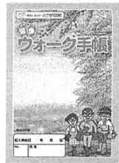
▲平成 30 年度版 ウォーク手帳