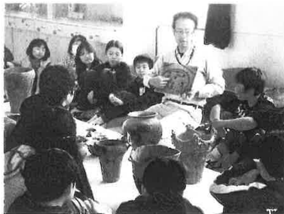
昨年度 (平成 29 年度) の授業風景

4 その他 各校での実施時間は、 4 月 10 日以降に決定しま す。見学・取材等を希望 される場合は、下記まで お問い合わせください。