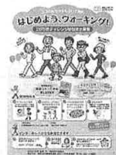
▲20 万歩チャレンジ チラシ