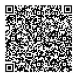
申込二次元コード