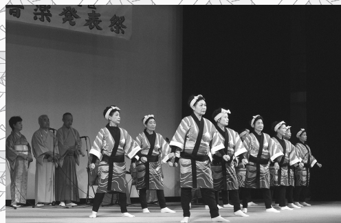
昨年の芸能音楽発表祭より