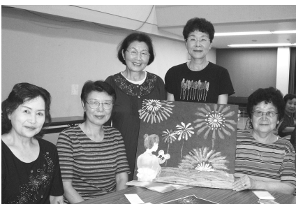
▲完成したちぎり絵と一緒にハイポーズ

記念作品として ”紫雲寺”を「ちぎり絵」で美しく 8月24日(水)、五葉大学開講40周年を記念して、和紙ちぎり絵新発田サークルの皆さんを講師に招き、五葉大学生が大きなキャンバスにちぎり絵を共同制作しました。 五葉大学は、昭和46年5月に開講し、当時高齢者の増大に伴う生きがい対策の一環として高齢者大学(五葉大学)が開設され、年々活発に活動されてきました。今回参加した学生からは「40周年記念の思い出に残る作品を作り、難しかったけれど楽しくできて、本当に嬉しかったです」また、「初めてのちぎり絵の挑戦でしたが、皆さんと協力しながらの作業はとても楽しかったです」と、声を弾ませて取り組んでいました。 ちぎり絵のテーマは「紫雲寺」。紫雲寺にまつわる「れんぎょう・さくら・花火・メジロ・稲穂・五葉松」の6種類の作品を力を合わせて完成させました。この作品は、紫雲寺地区文化祭(10月29日、30日)に展示します。五葉大学生が心を込めて作った作品をぜひご覧ください。