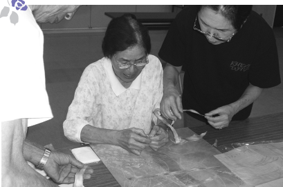
▲「ちぎり絵」に挑戦する五葉大学生