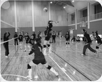
▲ 昨年のバレーボール大会から