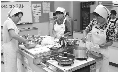
▲ 果敢に料理づくりに臨む参加者