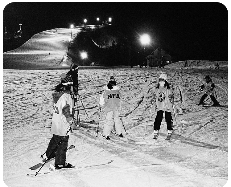
幻想的なゲレンデでスキーを楽しむ子供たち