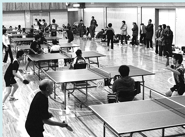
ズラリと並んだ卓球台。熱気に満ちた試合会場 (加治川地区体育館)

1月26日(日)、加治川地区体育館において、紫雲寺・加治川オープン卓球大会が開催され、過去最多となる146名の老若男女が寒さを吹き飛ばす熱戦を繰り広げました。