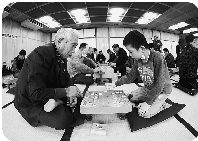
おっと！そう来たか……この子もなかなか…。

2月2日(日)、紫雲寺児童館和室において恒例の囲碁将棋大会が開催されました。 今年度は、囲碁の部に23人、将棋の部はAクラスに10人、Bクラスに19人の参加があり、将棋の部Bクラスでは2人の小学生が勝利を目指し、最後まで諦めずにがんばっていました。 囲碁の部では、新潟市から参加した女性が3位入賞するなど盛り上がり、地域や世代、性別を越えた楽しい交流大会となりました。