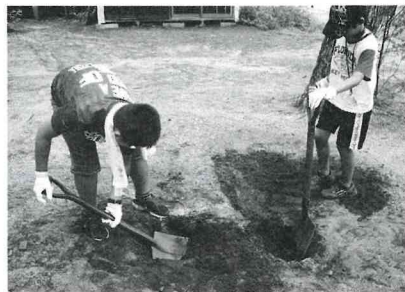
▲穴を掘ってかまどづくり