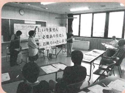
▲対応の仕方を学ぶ様子

また、9月4日（金）の第6回学習会では月岡カリオンパーク内にある『びいどろ』へ行き、ガラス細工体験をしてきました。