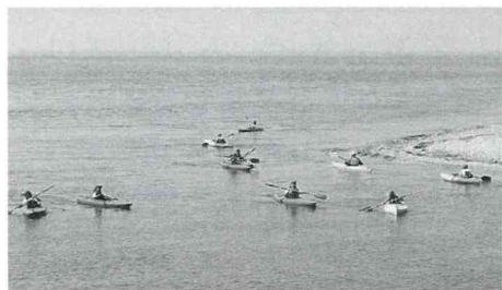
▲カヌーに乗って海まで

キャンプ初日の胎内川でのカヌー体験は、天候に恵まれ、波も穏やかだったので、海のすぐ近くまで行くことができました。ほとんどの部員がカヌー初体験でしたが、あっという間に上達し、みんな楽しそうにカヌーを漕いでいました。