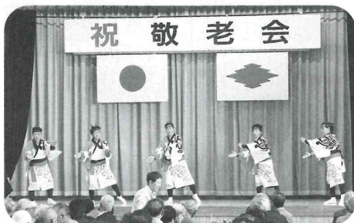
▲ 昨年のアトラクション風景