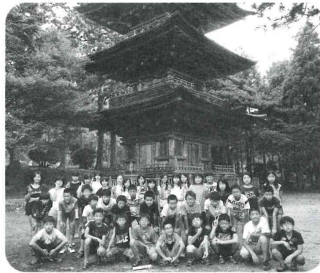
胎内市の乙宝寺で記念撮影 ～魚沼市須原小・藤塚小各6年生～