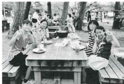
▲上手にできました♪