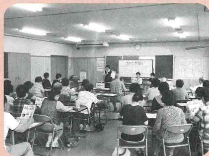
▲悪質商法について学ぶ様子