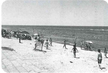
日本海をバックに熱戦が繰り広げられ 長野県飯山市からのチームが優勝!