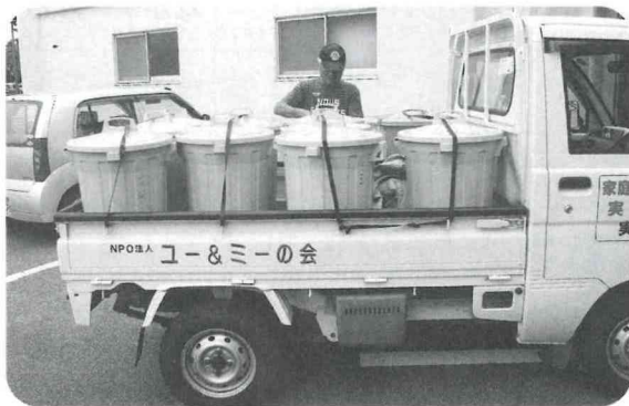
▲週2回残さを回収している「ユー&ミーの会」