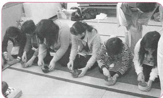
▲真剣に抹茶を泡立っています。

茶道は初めてという子も多くいて、最初は戸惑っている子もいましたが、木槿会さんのていねいなご指導のおかげで、大変貴重な経験をさせていただきました。