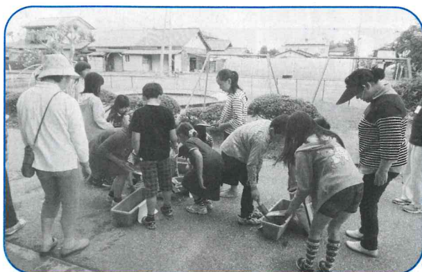
▲3名の育成委員さんに協力をいただいて大豆の種を植えました

風の子クラブへの入部は随時受付していますので、お気軽に紫雲寺地区公民館へお問い合わせください!