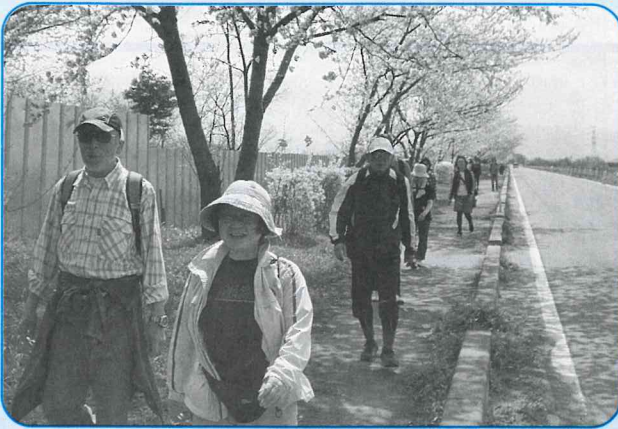
▲桜とれんぎょうが色鮮やかです