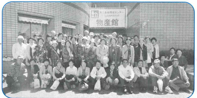
▲参加者全員で記念写真

5月19日(金)の第2回学習会では、燕市にある『防災センター』へ行き、火災現場で煙の中を歩く体験や震度7の揺れを体験し、防災について学ぶことができました。