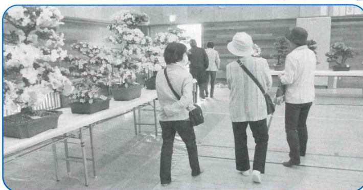
▲あでやかな「花の競演」に感動