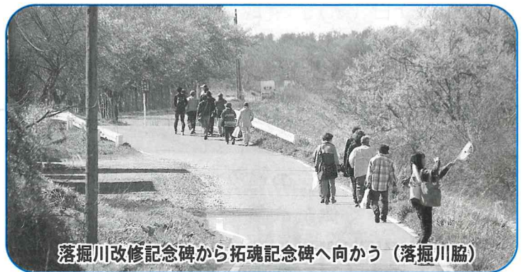
落掘川改修記念碑から拓魂記念碑へ向かう(落掘川脇)