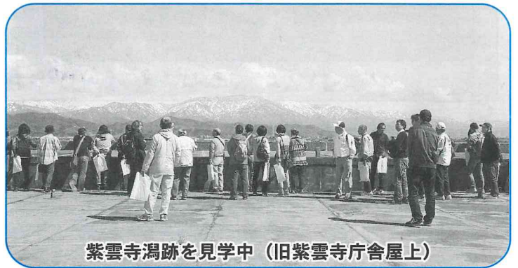
紫雲寺潟跡を見学中(旧紫雲寺庁舎屋上)

紫雲寺地区公民館 ⇒ 旧紫雲寺庁舎屋上 ⇒ 落掘川改修記念碑 ⇒ 拓魂継承碑 ⇒ ギャラリー葉(休憩) ⇒ 間藤家住宅 ⇒ 鶴林庵 ⇒ 紫雲寺地区公民館