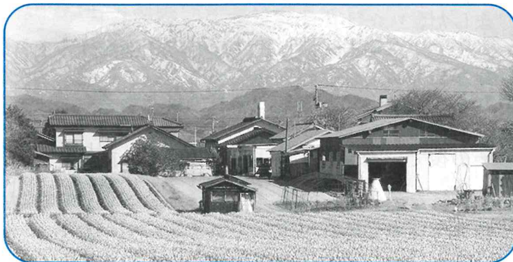
▲紫雲寺砂丘より飯豊連峰を望む(真中地内)