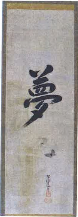
翠濤(直諒)の書「夢」(銘 翠濤庵一筆)