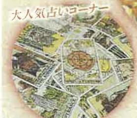
大人気占いコーナー