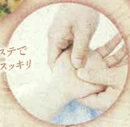
ハンドエステで 心も体もスッキリ