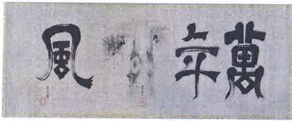
「萬年松風」茶道遠州流9世の小堀宋本が【萬年 風】の書を書き、景山(直諒)が【松】の絵を描いた共同制作品