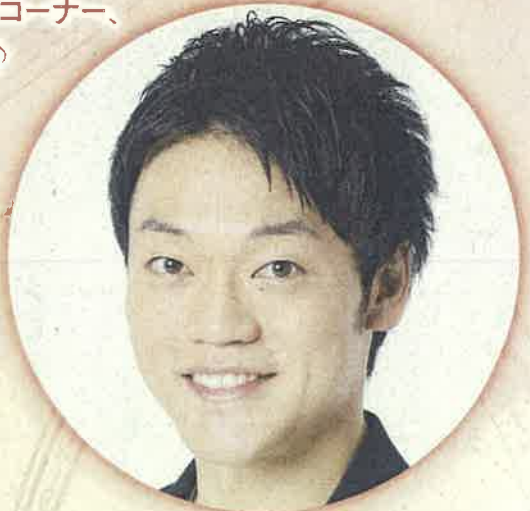
おばたのお兄さん