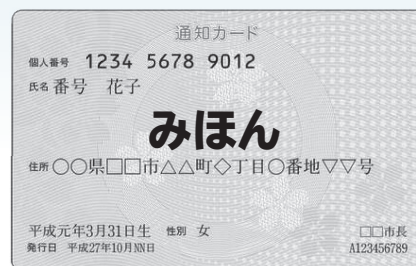
マイナンバー通知カード

※5月25日以降に出生または外国から転入の届け出を行うなど、新たにマイナンバーを付番される方には、個人番号通知書を送付します。ただし、同通知書はマイナンバーを証明する書類としては使用できません。