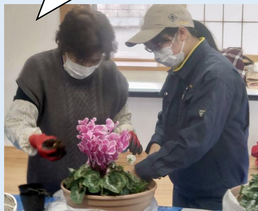
熱心に地域の方に指導する農業高校の生徒さん