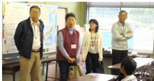
多彩な講師陣（現在17名の方が協力してくださっています）