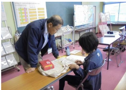
常に子ども目線で