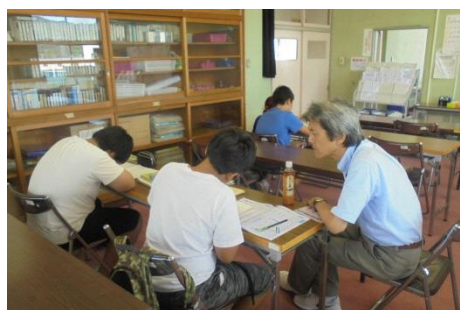
一人一人の実態に応じた対応