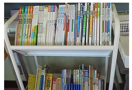
学校で使用している教材や辞書、辞書