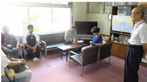
開始前の講師とコーディネーターとの打合せ (前回の様子についての確認などをします)