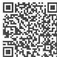
【スカイランタン配信 QR コード】