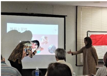
いんどねしあ しょうかい インドネシアの あいさつを 紹介！