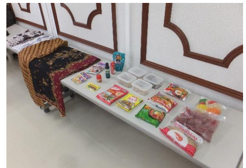
いんどねしあ たもの みんなくいしやう インドネシアの 食べ物や 民族衣装