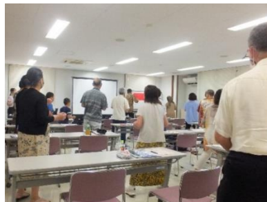
さんかしゃ みな いっしょ たんす♪ 参加者の 皆さんも 一緒に ダンス♪