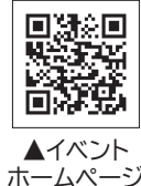
▲イベントホームページ

みんなでワクワク！ しばたのちいさな物語 親子で楽しむ謎解き今昔フォトウォーク！！ 延期のお知らせ