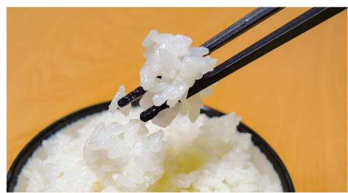
粒がそろい、透明感があってツヤツヤなお米。一口食べると、上品な香りと甘みが口いっぱいに広がります

アサテラの会 時 12月19日(土)午前8時～9時 所 瑞雲 寺(中央町1) 内 すがすがしいお寺の朝 を感じながら、座禅を行います 問 同会 齊藤(タイコヤ内、☎26-6269)