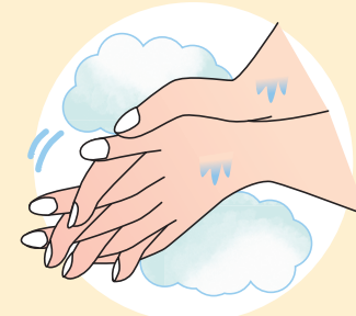
④指の間を洗います。