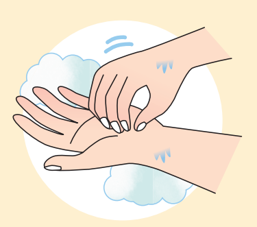
③指先・爪の間を念入りにこすります。