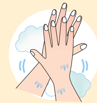
②手の甲をのぼすようにこすります。