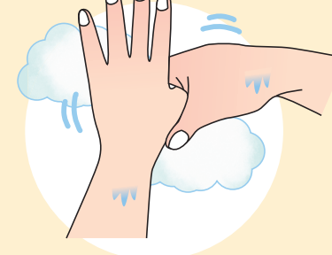
⑤親指と手のひらをねじり洗いします。