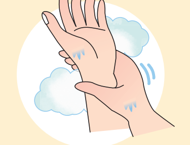
⑥手首も忘れずに洗います。

石けんで洗い終わったら、十分に水で流し、清潔なタオルやペーパータオルでよくふき取って乾かします。