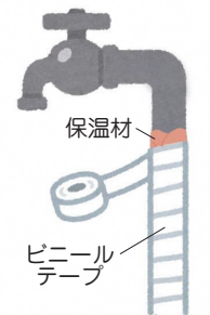
保温材を巻いて冬じたく