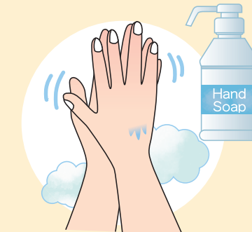
①流水でよく手をぬらした後、石けんをつけ、手のひらをよくこすります。