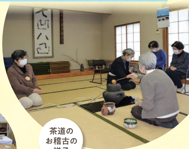
茶道の お稽古の 様子