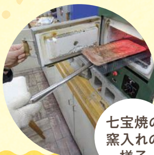
七宝焼の 窯入れの様子