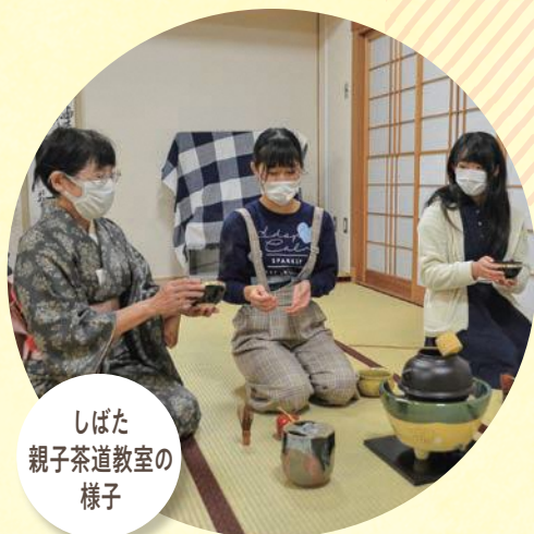
しばた 親子茶道教室の 様子