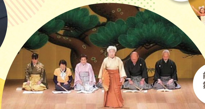
能楽の舞台の様子