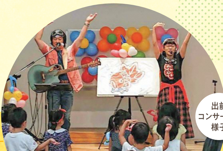
出前 コンサートの 様子