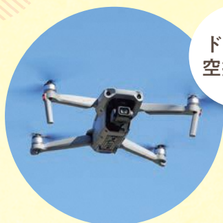
ドローン空撮体験