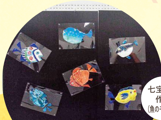
七宝焼の 作品 (魚のモチーフ)