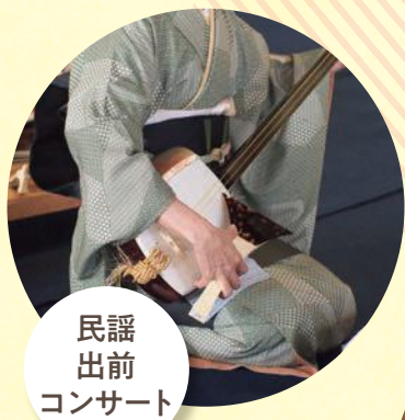
民謡出前コンサート