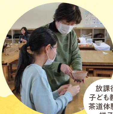
放課後 子ども教室 茶道体験の 様子