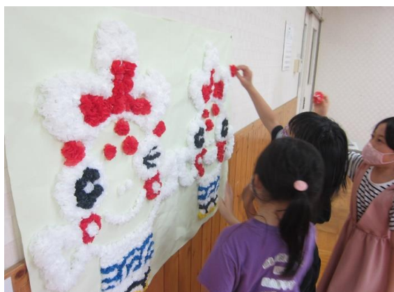
<わくわくシールラリー>