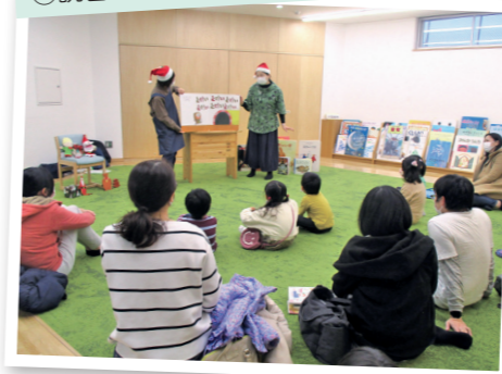
①読書の楽しさを伝える読み聞かせ