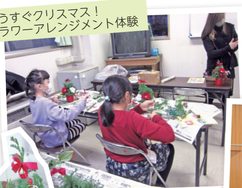
①もうすぐクリスマス！ フラワーアレンジメント体験