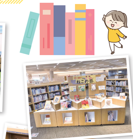
②子どもの発達に応じたおすすめ図書の紹介