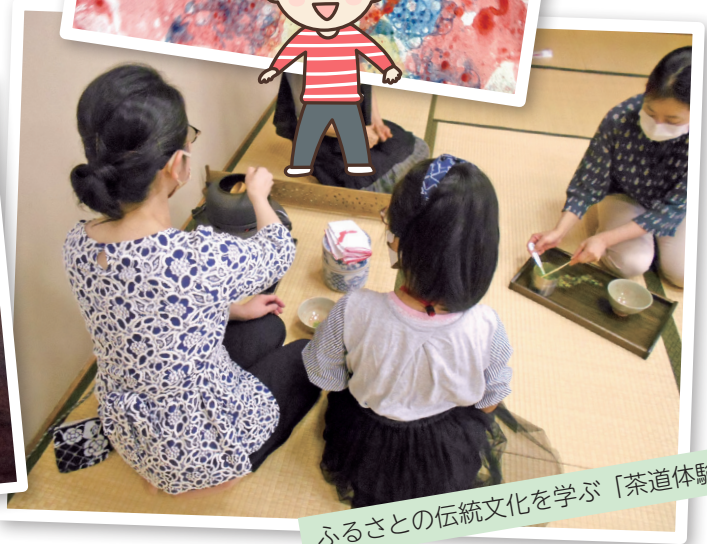
ふるさとの伝統文化を学ぶ「茶道体験」