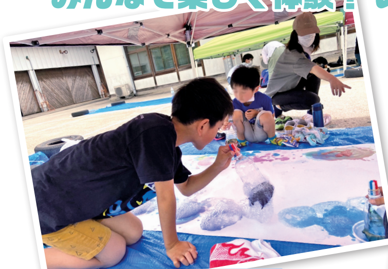
「シャボン玉アートを作ろう♪」 in 城山温泉