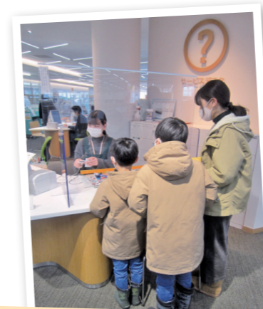
③図書探しを支援するレファレンスサービス