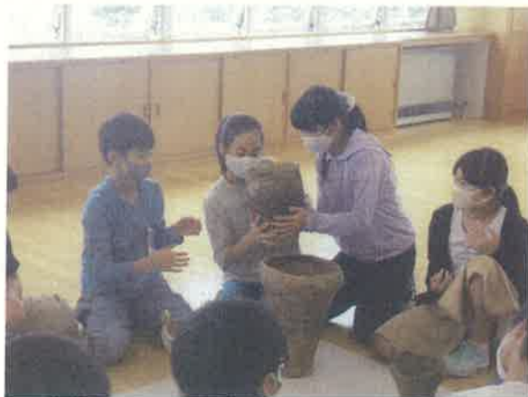
昨年度（令和3年度）の授業風景