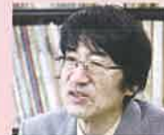
後藤 丹 作曲家 上越教育大学名誉教授