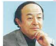
池辺 晋一郎 作曲家 東京音楽大学名誉教授