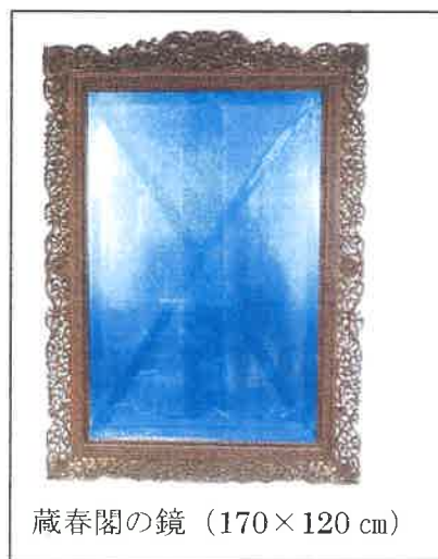
蔵春閣の鏡 (170×120 cm)