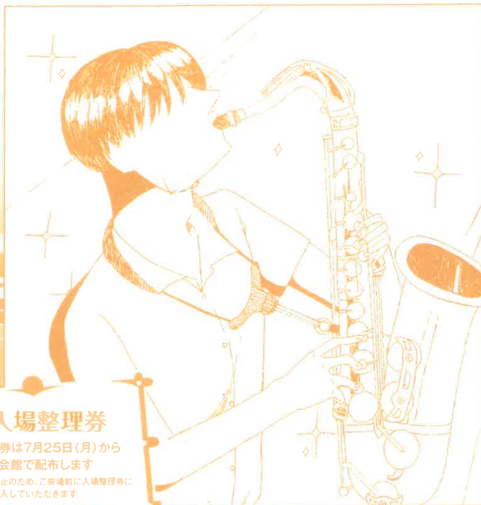
イラスト 新発田高校 ブラスバンド部

H I G H S C H O O L M U S I C F E S T I V A L