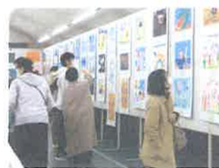
※昨年度のジュニア展の様子